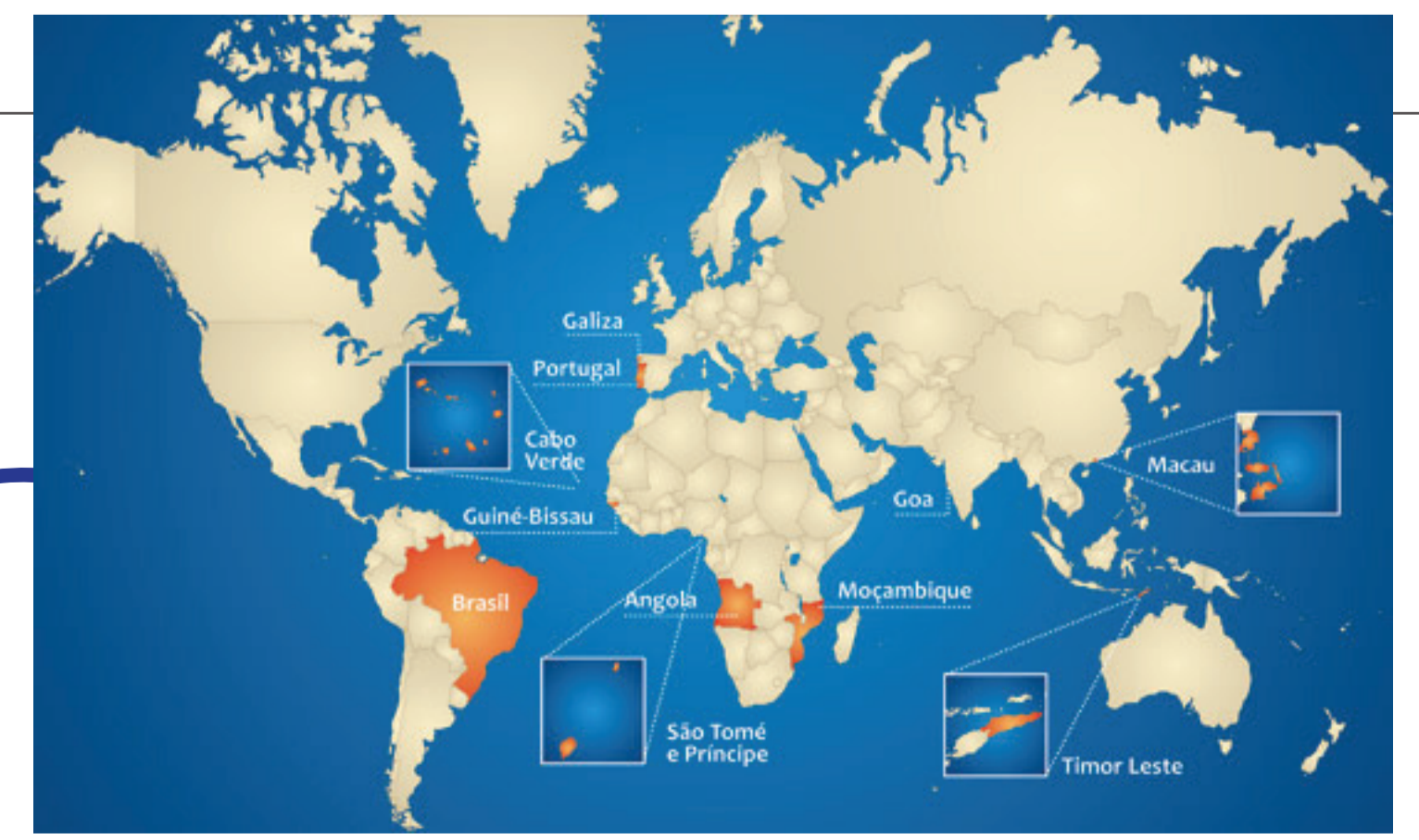
Países que têm o Português como língua oficial.

Com os descobrimentos, o Português foi levado às terras dominadas pela Coroa portuguesa. Atualmente os falantes do Português contabilizam mais de 210 milhões no mundo.